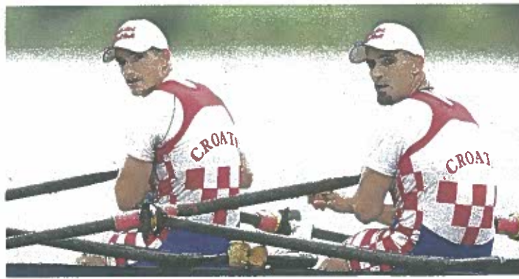
Martin i Valent Sinković